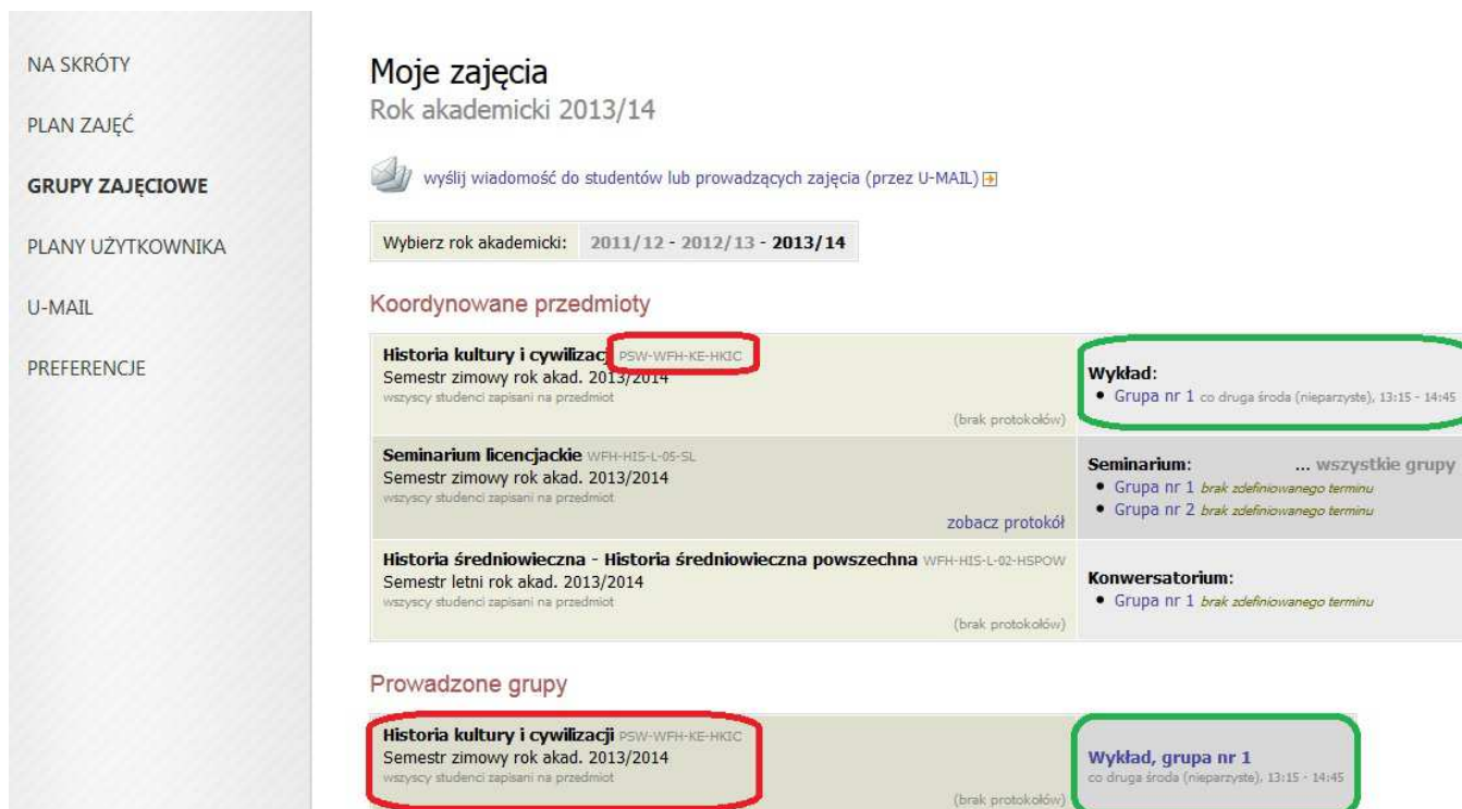
Rys. 2. Moje zajęcia w USOSweb

Przedmioty PSW łatwo zidentyfikować, gdyż rozpoczynają się od kodu PSW oraz powinny mieć podany termin odbywania zajęć.