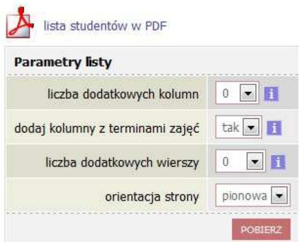
Rys. 4. Lista studentów w PDF

Listę możemy wydrukować klikając na link „lista studentów w PDF”